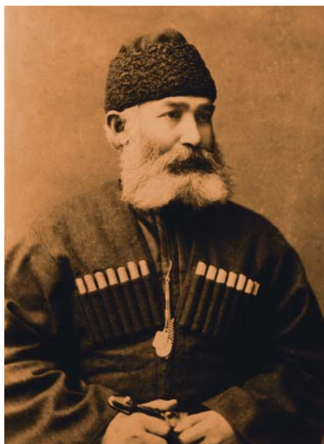
Гадо Хусинаевич (Михаил Георгиевич) Баев

фической службы Кавказского военного округа. В 50-х гг. XIX в. был избран председателем открытого на Кавказе Русского географического общества. Был назначен на должность начальника Бессарабского военного округа. Возглавлял две экспедиции по установлению границ России с Персией и Афганистаном. Являлся автором исторического очерка «Тагаурское общество и экспедиции генерала-майора князя Абхазова в 1830 г.» [3, 35-38].