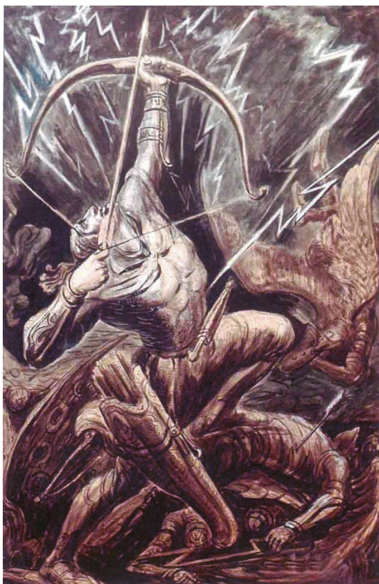
Рис. 2. Батраз в борьбе с небом. Худ. М. Туганов

Он участвовал в художественных выставках, занимался художественным оформлением спектаклей, много работал в области книжной графики. Живописные полотна и графические произведения, созданные в 1930-е — начале 1950-х гг.: «Бой Сослана с великаном», «Похищение сестры великанов», «Балсагово колесо», «Нарт Сырдон», «Клятва нартских женщин», «Батраз в борьбе с небом», «Гибель нартов», «Пир нартов» и другие служили подлинным украшением изданий нартских сказаний. Туганов иллюстрировал книгу «Нарты. Осетинский народный эпос», выпущенную в 1942 г. в г. Сталинире (Цхинвале). Он был автором художественного оформления и иллюстраций фундаментального прозаического свода «Осетинские нартские сказания» на русском языке, изданного в 1948 г. в г. Дзауджикау, и т.д.