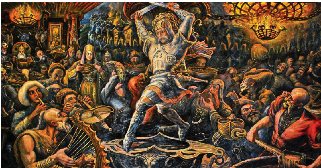
Рис. 3. Пир нартов. Худ. М. Туганов

При оформлении примечаний использовались материалы из трехтомного академического свода «Нарты. Осетинский героический эпос», сборника «Махарбек Туганов. Статьи, воспоминания, письма» и издания «Хроника жизни и творчества художника Махарбека Туганова» [10; 11; 12].