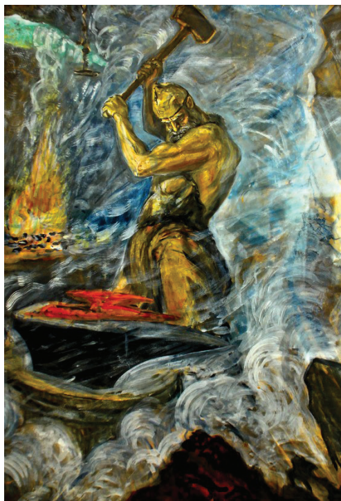
Рис. 4. Курдалагон — небесный кузнец. Худ. М. Туганов

В 1910 г [оду] я вновь решил взяться за работу над нартами. В то время нам удалось создать свой кружок художников, куда вошли местные художники, учителя по рисованию и любители изобразительного искусства. Нам удалось даже организовать выставку. На эту выставку я принес первым долгом портреты Нарт Сослана, Урузмага и Хамыца. В том же году вышла из печати моя первая книга на дигорском