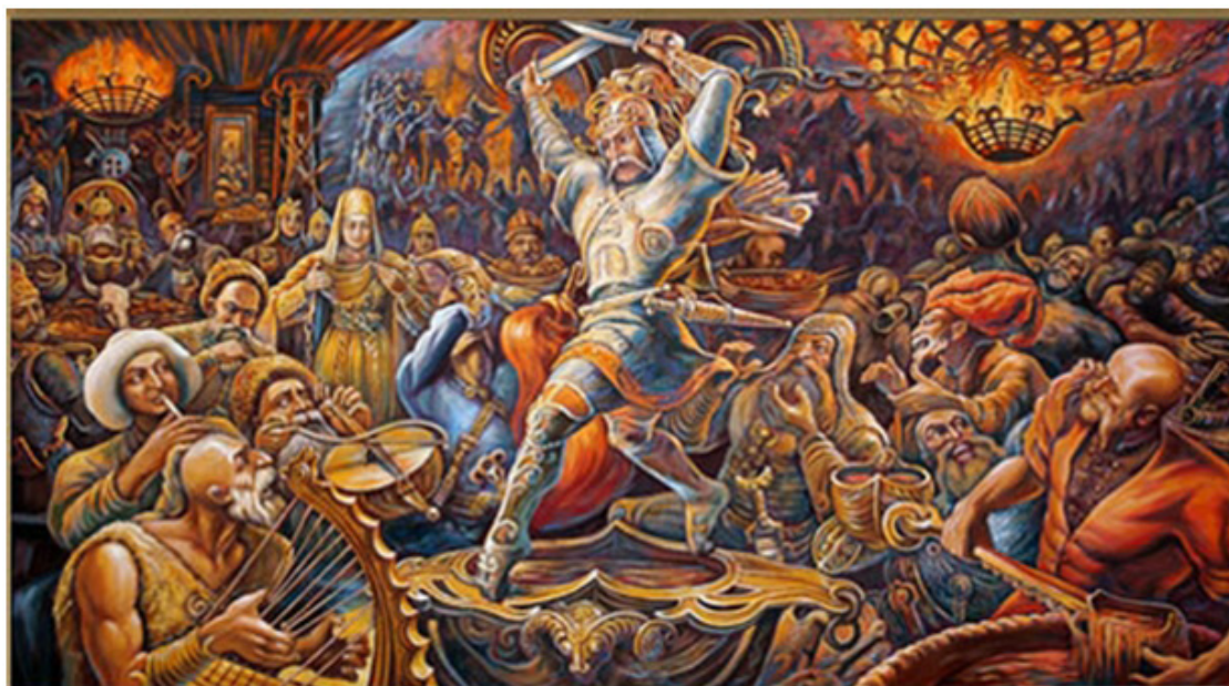
«Пир нартов», 1952